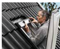
Montage du panneau solaire avec détecteur de pluie intégré