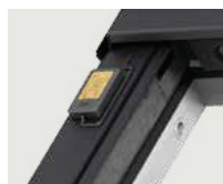
Détecteur de pluie sur la face extérieure sur une fenêtre de toit électrique post-équipée