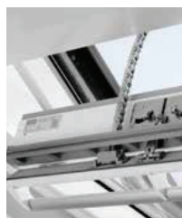
Fenêtres VELUX INTEGRA® avec entraînement silencieux intégré